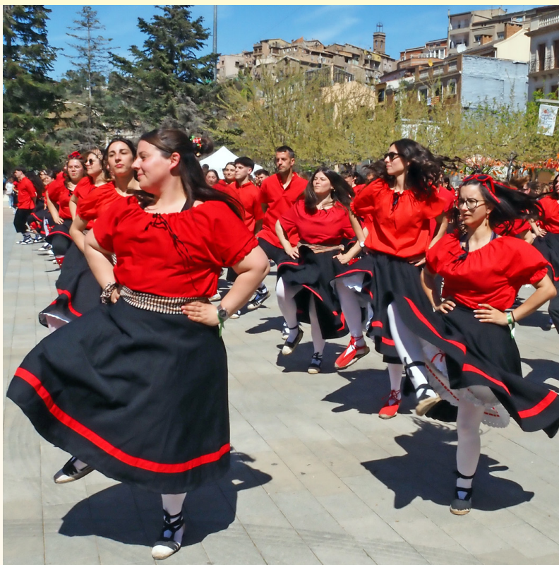
Actuació de l'Altatxu durant les Caramelles d'enguany (dreta), en què la colla surienca ha celebrat el seu 25è aniversari. A l'esquerra, ball dels nous gegants Miquel i Maria de l'Agrupació Sardanista i imatge de la plaça de Sant Joan durant la diada de Sant Jordi.