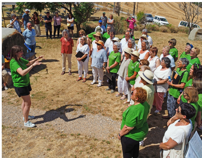
Descobriments de la placa commemorativa i actuació coral durant l'acte central de l'Any Magí Fàbrega a Cererols. Durant aquest 2026 es duen a terme diferents activitats en motiu del centenari de la mort d'aquest destacat jurista surienc.