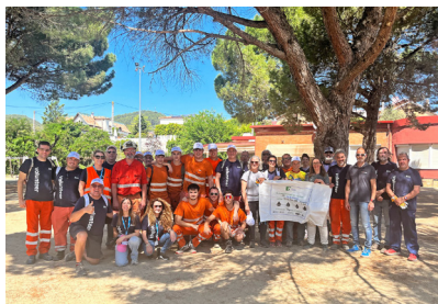
Participants en la campanya.

Les Escoles Verdes de Súria van tancar el curs 2025-26 amb tres dies d'activitats festives i de sensibilització ambiental al Parc Municipal Macary i Viader. En aquest curs, els centres suriencs han treballat especialment els temes relacionats amb la prevenció dels residus i el seu tractament.