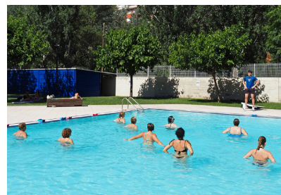
Aiguagim de l'Escola de Salut.

La 5a Escola de Salut de Súria va cloure la seva 5a edició el 18 de juny, després d'haver portat a terme més d'una vintena d'activitats des del passat febrer. L'organització ha anat a càrrec de l'Institut Català de la Salut i l'àrea de Sanitat de l'Ajuntament, amb la col·laboració d'entitats i institucions.