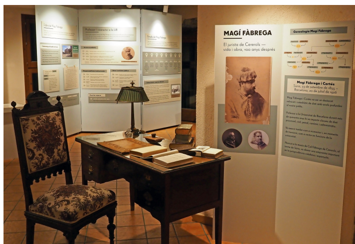
Plafons de l'exposició dedicada a la vida i obra de Magí Fàbrega.