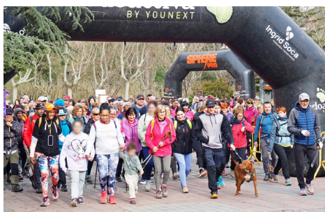
Sortida de la Caminada de la Dona.

El programa d'actes del Dia Internacional de la Dona també va incloure una nova edició de la Caminada de la Dona i un teatre-fòrum a l'Institut Mig-Món.