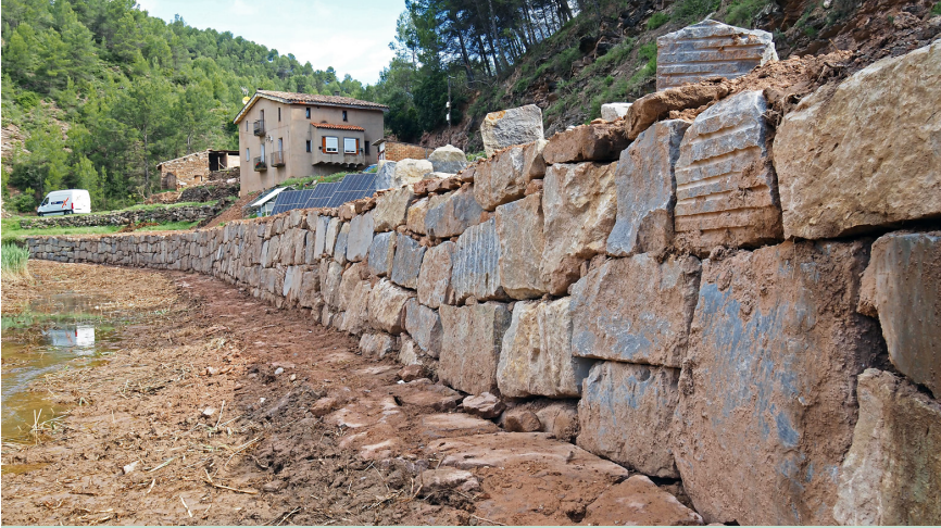
Tram d'escullera construït al barri de Cal Trist, a l'entorn de la riera d'Hortons. Les actuacions volen prevenir els efectes de possibles nous augments de cabal.

L'Ajuntament ha reforçat la protecció del barri de Cal Trist davant possibles augments de cabal de la riera d'Hortons, amb la construcció de diferents trams d'escullera, el desbrossament de vegetació i tala d'arbres, la retirada de material d'arrossegament i la restauració de la zona afectada per l'aiguat del juliol de l'any 2025.