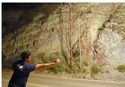
Explicació al davant de Migmón.