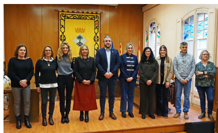
L'acte central del 8-M va omplir la Sala del Portal del Casinet del Poble Vell.

A sota, taula rodona i recepció institucional a la consellera d'Igualtat i Feminisme.