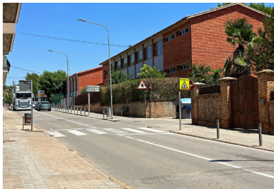
Entorn del pas de vianants.

L'Ajuntament ha demanat a la Generalitat que reforci la seguretat viària a l'entorn del pas de vianants de la carretera de Balsareny, com a institució titular d'aquesta via pública. La petició s'ha fet després de la recent retirada de les dues bandes que l'Ajuntament va instal·lar per obligar els vehicles a reduir la velocitat, arran de diverses incidències de trànsit. La col·locació de les bandes va ser denunciada a la Generalitat per una persona particular que va al·legar el tema de la titularitat del tram.