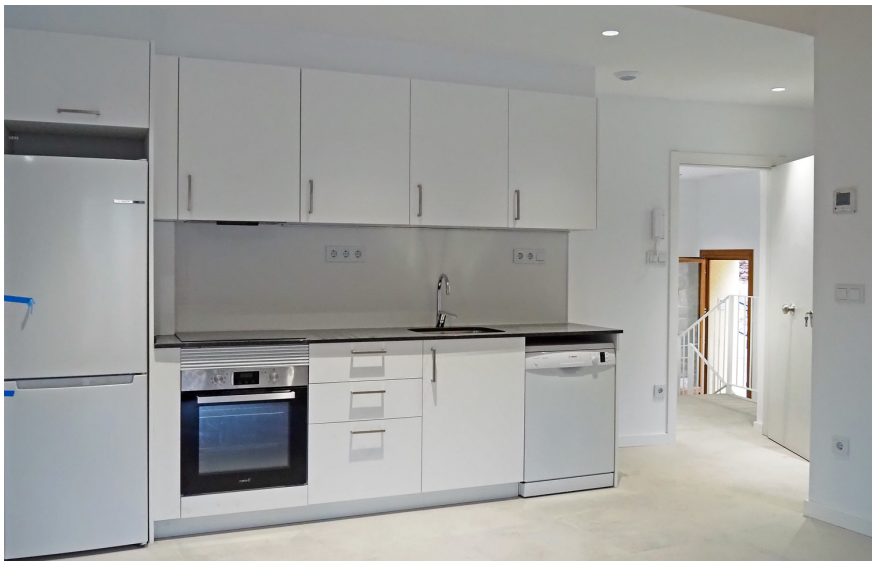
Interior d'un dels habitatges municipals que han estat habilitats a Cal Ton Bató. L'accés a les convocatòries d'adjudicació requereix la inscripció prèvia en el Registre.

La Generalitat de Catalunya licitarà properament la construcció de més d'una trentena d'habitatges de protecció oficial (HPO) al centre de la vila. Es tracta de la primera gran promoció d'habitatge públic que la Generalitat planteja al municipi des de fa gairebé vint anys,