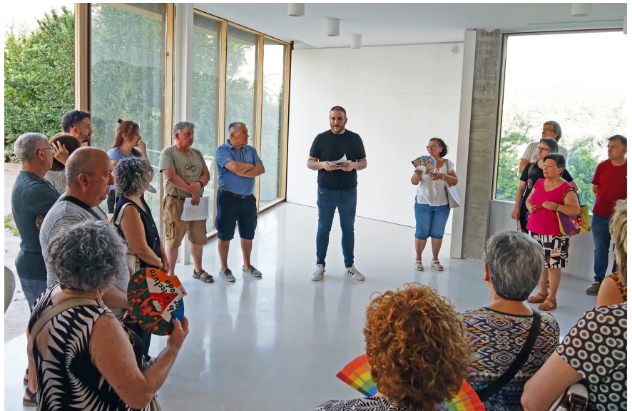
Visita a l'interior de l'equipament, amb el guiatge de l'alcalde Albert Coberó. L'objectiu és inaugurar la nova Biblioteca-Centre Cultural a finals d'aquest 2026.

La nova Biblioteca-Centre Cultural es convertirà en un dels grans motors culturals i socials de la vila, amb una superfície de gairebé 2.000 metres