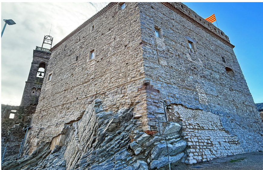
Les façanes nord i est del Castell, després dels treballs de restauració.

La intervenció ha donat relleu a singularitats destacades de l'emblemàtic edifici.