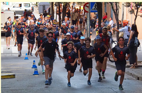
Arribada de la Flama del Canigó en la Nit de Sant Joan.