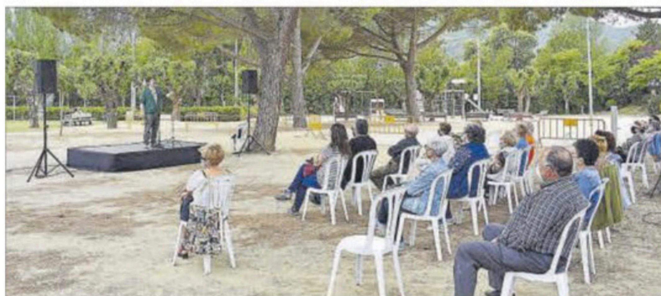
AJUNTAMENT DE SÚRIA