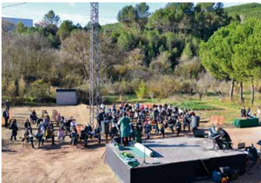
El públic va seguir l'acte d'homenatge des de l'espai habilitat a l'horta de davant de cal Cabo.