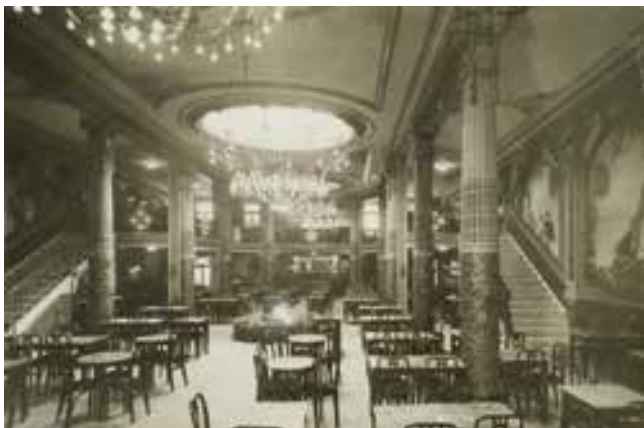
El Saló Doré de la Granja Royal, en una imatge dels anys 30. Als concerts que es feien en aquest local del carrer de Pelai de la ciutat comtal, Perarnau hi conegué Domènec Moner, que musicà “Oració humil” i “L'Alta Amor”.

D'aquests mateixos anys són també les sardanes “Lloret de Mar” i “Montserrat”, en aquest cas amb música d'Artur Rimbau i Clos (1898-1978).