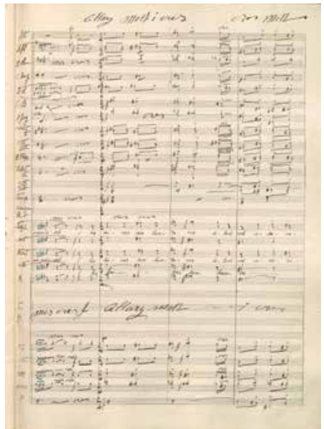
Fragment de l'edició manuscrita de "La Vall de la Bruixa", l'obra musical més rellevant amb text de Perarnau. Al costat, el seu compositor, Enric Morera i Viura.

Segons la premsa de l'època, aquesta obra va estar a punt d'estrenar-la la Institució del Teatre Líric Català el 1938, en plena Guerra Civil. El 1970, però, en un article de Ramon Fàbrega i Sivila al setmanari "Suria" 12 , fet a partir de les explicacions del poeta, s'apuntava a que aquesta obra havia d'obrir la temporada 1936-37 del Gran Teatre del Liceu barceloní, que es cancel·là amb motiu de la guerra, un fet del que no hem trobat cap més referència.