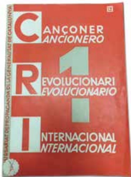
BIBLIOTECA DE MONTSERRAT

Primer volum del Cançoner Revolucionari Internacional, publicat pel Comissariat de Propaganda l'estiu de 1937. Les adaptacions al català de dues de les cançons són del poeta surienc.