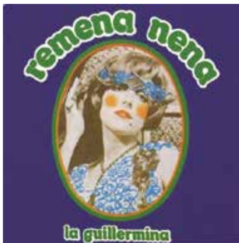
Portada de l'àlbum "Remena nena", de Guillermina Motta, que popularitzà "La xava de Sants".