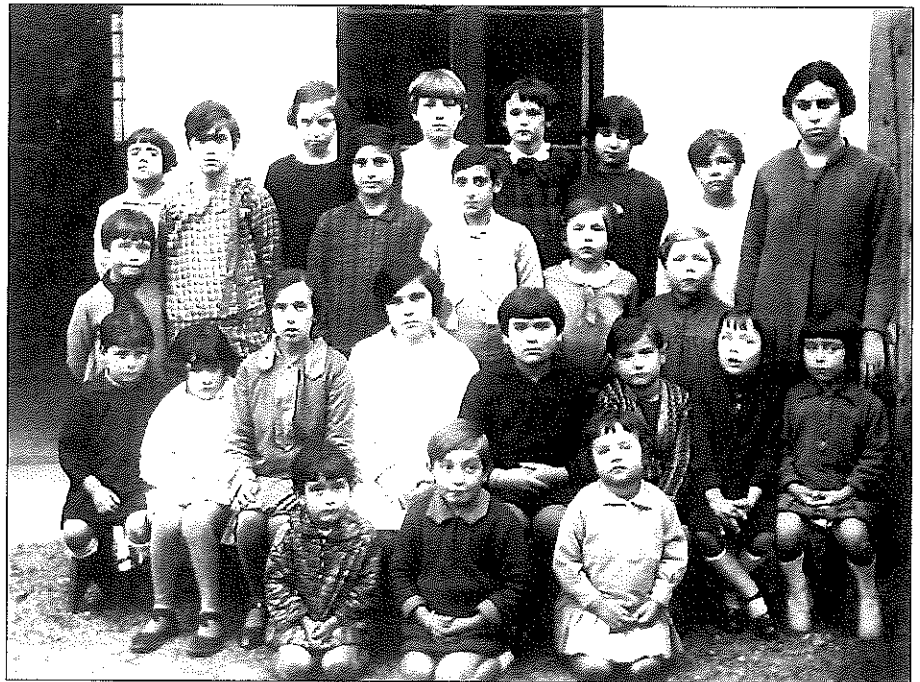
Alumnes de l'escola Montserrat a l'any 1928, un any després de ser inaugurada

barri, va néixer a principis de 1903 i vivia al cèntric carrer Viladomat. La família volia instal·lar-se en un lloc allunyat del centre de la ciutat –atès que la filla estava delicada de salut– i va adquirir un terreny, que va costar 7.500 pessetes de l'època, al carrer del Doctor Valls número 5 –avui número 11– on va construir la casa. La salut de la filla, que aleshores tenia poc més de vint anys, va millorar al poc temps tant pels aires del Guinardó com pel fet de dedicar-se en cos i ànima a una professió que estimava.