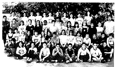
Grup escolar de 1931 i, a la dreta, de 2002, 71 anys de distància

constituir com a cooperativa de mestres i va esdevenir l'escola Guinardó, que és el seu nom en l'actualitat. El centre ha anat creixent amb el temps i avui compta amb set espais distribuïts en la zona pròxima al mercat del Guinardó que apleguen prop de 700 alumnes, una xifra molt superior i allunyada de les onze alumnes que van començar a l'escola l'any 1927. El centre acull avui tot el cicle formatiu, des de P-3 fins a quart d'ESO.