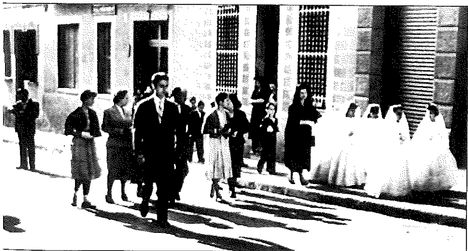
Primera Comunió al carrer del Doctor Valls