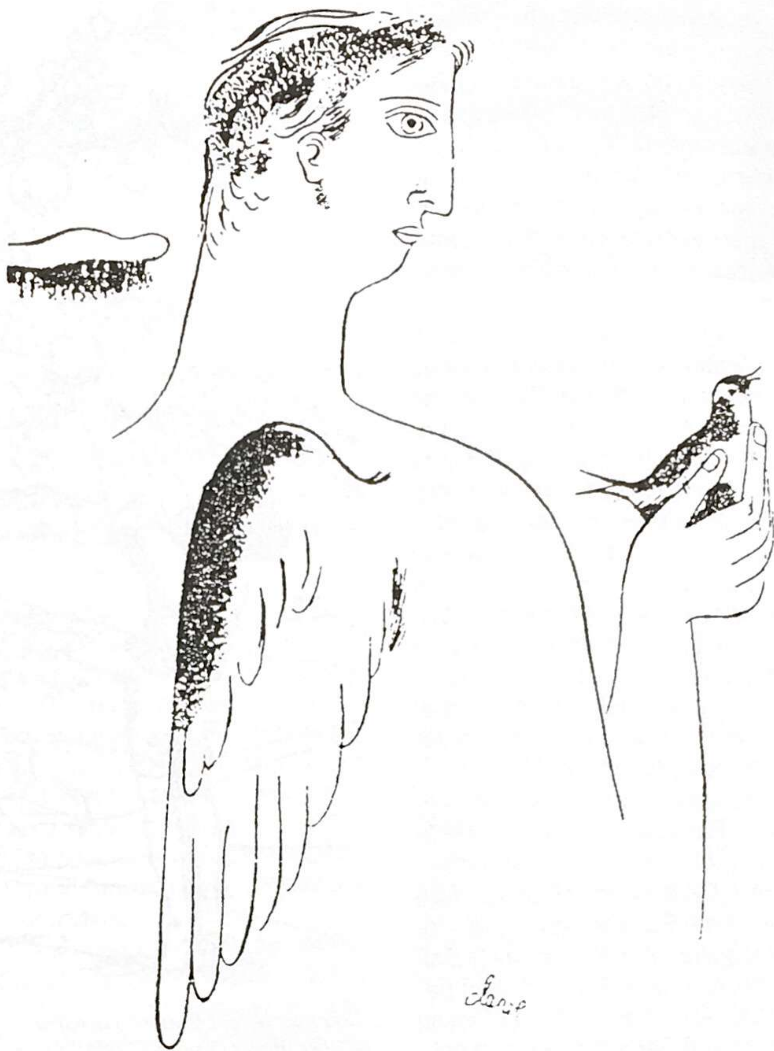
Dibuix de l'avanguardista Antoni Clavé per al llibre Ales Humanes (1938). Correspon al poema «L'espatlla».

I, per últim, ens referirem a El Senyor Pèsol i altres plantes , editat l'any anterior, el 1937. Un llibre d'un cert gruix, ben imprès, amb les insubstituïbles il.lustracions de Junceda. Joan Junceda (Barcelona 1881 - Blanes 1948) era el dibuixant més paradigmàtic i, tal vegada, el millor de Catalunya en aquell període. El seu art era en plena maduresa. Havia dedicat la major part de la seva obra als infants. Tanmateix, la seva activitat com a il.lustrador abarcà totes les especialitats, des del llibre de bibliòfil als petits impresos i publicitat, tot passant pel còmic, el satíric, el gravat i el llibre il.lustrat de tot tipus. S'havia iniciat com a professional el 1902, a la revista satírica ¡Cu-Cut! , i col.laborà en moltes publicacions que feien del catalanisme polític el seu