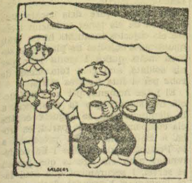
ELS GRANS ANTIFEIXISTES - Si totom fes com jo, salvariem Euzcadi de seguidia.

PREUS DE SUBSCRIPCIÓ: Barcelona un any 550 pts. Fora un trimestre 180 »