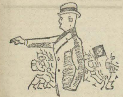
ITALIA Y ALEMANIA VUELVEN AL CONTROL EDEN. - No llegarán más tropas extranjeras a España...