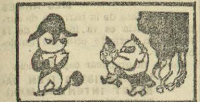
EL HERMANO DE PEPE BOTELLA - ¿Es que no os ha servido de nada mi experiencia?