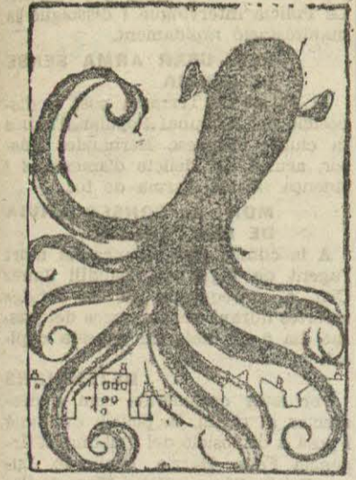
ESTA ENTRE NOSOTROS - Nos espia. Se alegra de nuestras desgracias. Oye la radio enemiga. Acapara viveres. Se regeña cuando caen obuses. Lo mismo lanza un bulo que hace un sabotaje en un barco. ¿Hasta cuando?