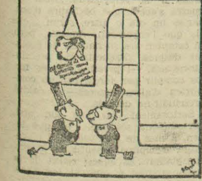
ENTRE DIPLOMATICOS - Los del Comité cominarian enramamiento a Valencia y a Salamanca para que humanicen la guerra...

Rètol's per a apuradors Casa Grau Mercaders, 36 - Tel. 25645