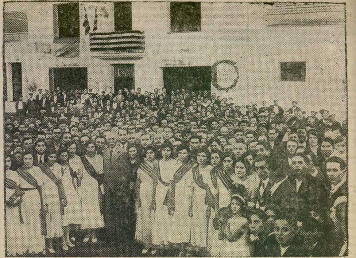
El President de la Generalitat en l'acte de la inauguració de les Escoles «Pi i Sunyer» celebrat el passat diumenge a Bellver del Penedès