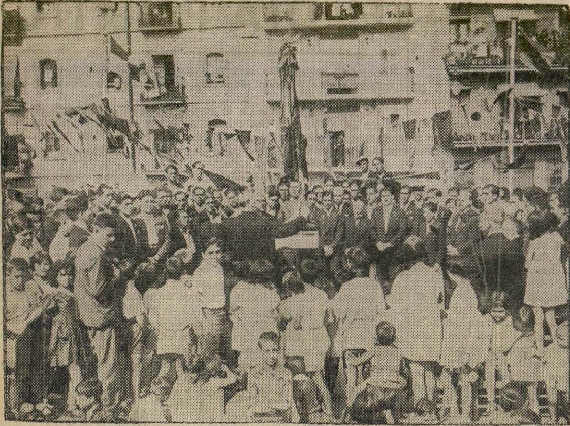
Concert donat per una massa coral a la Plaça Magrinyà