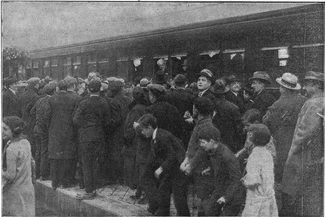
L'arribada del tren expedicionari a Sitges.

L'"Elenc artístic arbosenc" ha construït una "roulotte" com la de "L'alegria que passa", que ens surt al pas, tripulada