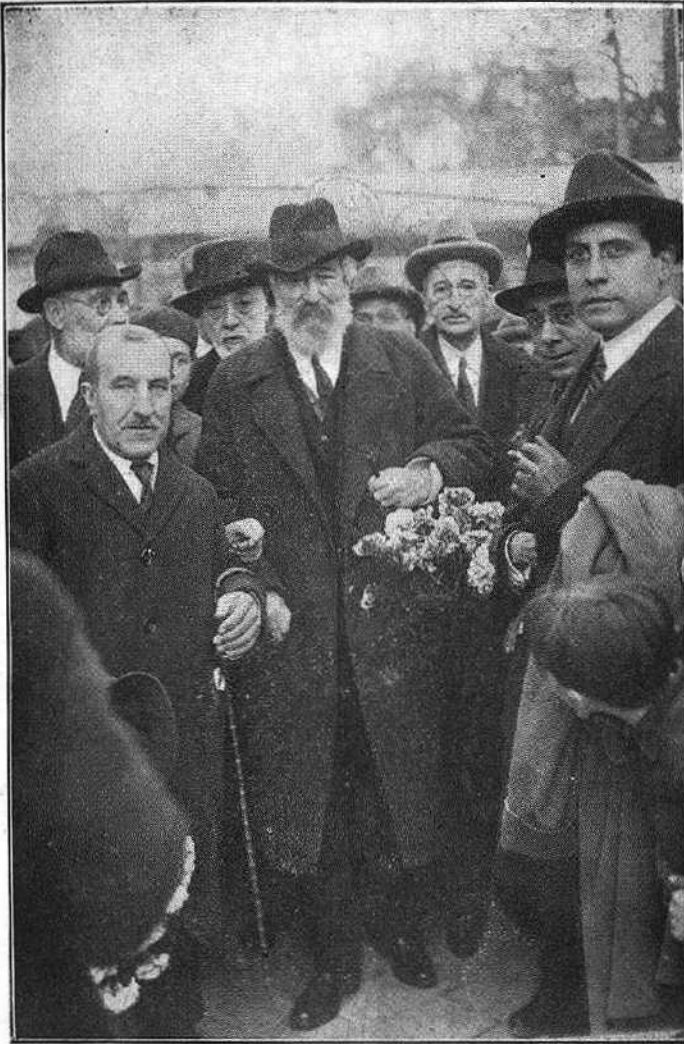
El cap de la manifestació camí del "Cau Ferrat".

acompanyat tots i l'hem dut aquí; el nostre cor, en unir-se per festejar-lo, fatalment havia d'anar a parar en mig d'aquesta platja, havia de respirar el baf de les pedres d'aquest "Cau Ferrat", que és la cosa màgica d'aquest home, i és el palau d'uns ferros antics, roents de passió i d'espiritual entusiasme.