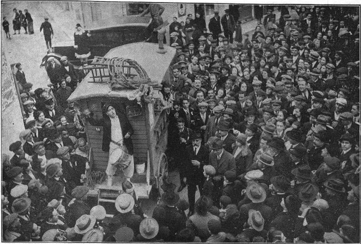
El carro de l'"Elenc Artístic Arbosenc", representant "L'Alegria que passa" al pas de la comitiva.

tan suauement, però tan remarcablement, que els seus descendents, tot veient-s'hi retratats i reconeixent-los, se n'han esporgat del tot i sols han conservat—com joia preada—totes les seves bones qualitats.