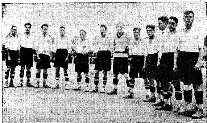
El primer equip del Granollers S. C. que guanyà a l'Atlètic de Sabadell, la Copa del nostre Ajuntament