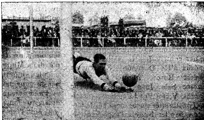
Un plongeon del porter granollerí, en un dels tres partits jugats per l'onzè local durant les passades festes