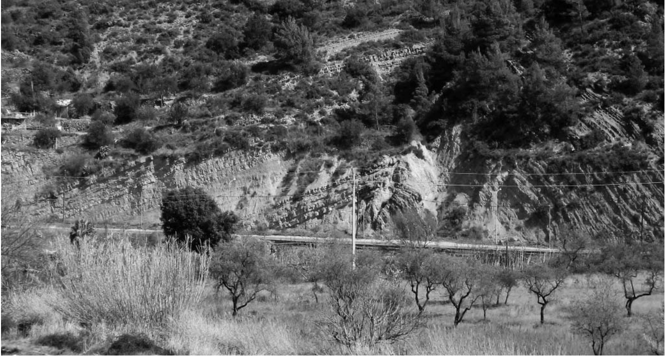
3. Mig-Món: un anticlinal fallat.

i es va llicenciar en dret. El 1854 va ser nomenat catedràtic d'economia política i dret administratiu a Santiago de Compostela. Més endavant va obtenir la càtedra de Historia del Comercio y Derecho Internacional Mercantil de l' Escuela Superior de Comercio de Madrid .