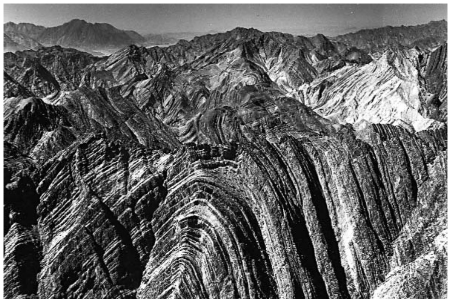
1. Un anticlinal.

L'anticlinal de Súria forma part de les estructures que deformen l'avantpaís del Pirineu a la Catalunya Central, juntament amb l'anticlinal de Cardona, l'anticlinal del Guix i l'anticlinal d'Oló.