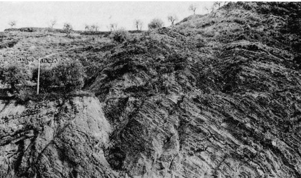
2. La falla de Mig-Món el 1926.

1722, on apareix com la Cabanassa 1 . Tornem a trobar el topònim els anys 1723, 1740, 1741, 1748 i 1752. El 1748 apareix com el raval del Cardener o de la Cabanassa 2 . En tots els casos apareix en la forma singular. A finals del segle XVIII el trobem ja en la forma plural. La primera documentació on apareix escrit com les Cabanasses és del 22 de gener de 1793, en un capbreu de Súria 3 . A partir de llavors gairebé sempre apareix en plural, tot i que, esporàdicament, podem trobar la forma singular, com passa l'any 1829 4 . És a partir de 1858 quan es comença la construcció de les primeres cases de l'actual barri de cal Trist, a la part inferior de la muntanya, a tocar la riera d'Hortons i molt a prop de la falla de Mig-Món.