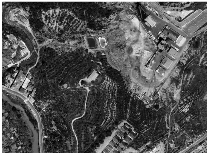
4. La muntanya de les Cabanasses.

un dels components de l'excursió, escrivia: Súria, en quals inmediacions un dels companys de viatge nos feu observar un punt que la gent del país anomenan Mitj mon, en rahó de veures' en un gran tall de roca a las voras del Cardoner una raresa geològica, consistent en una convergència en àngul