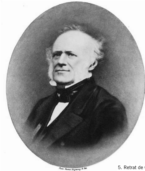
5. Retrat de Charles Lyell.