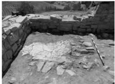
Figura 10: Estrat de guix a l'interior de la sala de la torre.

En la campanya de 2018, a la torre es van trobar dues sepultures. Una d'elles, molt malmesa, era a sota dels murs exteriors de la domus. L'altra, en molt millor estat, es troba a l'interior de la sala de la torre.