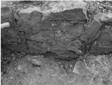
Figura 8: Paret de interior de l'església enquixada.