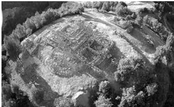
Figura 4: La domus de Torre l'estiu de 2019.