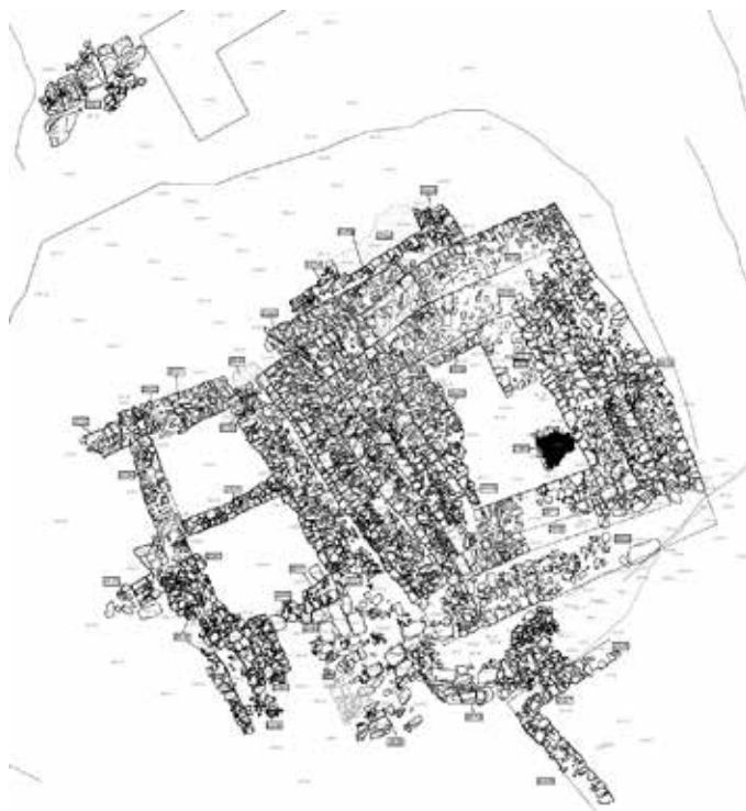
Figura 5: Planta de la domus del Puig de Sant Pere. Setembre 2018.