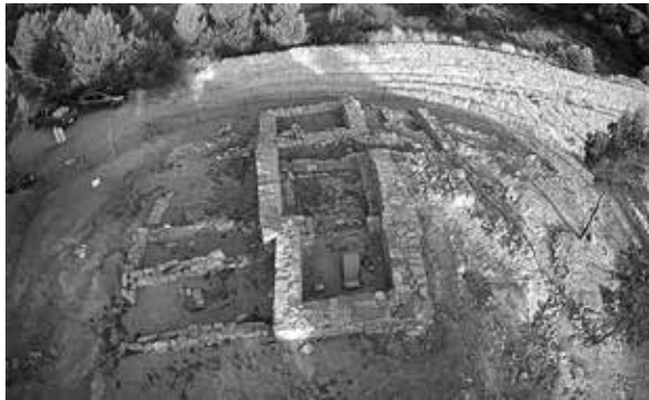
Figura 3: L'església de Sant Pere del Puig i el nucli de cases al seu voltant. Estiu de 2019.