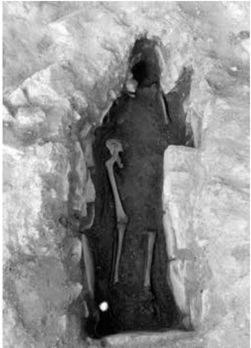
Figura 11: Sepultura en fossa antropomorfa de l'interior de la torre.

Cal suposar que en el moment de les inhumacions, la domus encara no existia, ni tampoc l'església i la necròpoli, ja que en aquest cas els cadàvers, amb tota seguretat, s'haurien dipositat a la sagrera de l'església. Atès que l'església i la torre són documentades des de l'any 1033, aquestes sepultures haurien de ser anteriors, i situades a l'exterior de la primitiva torre del Puig de Sant Pere, abans de la construcció de la domus. El fet que una d'elles és una fossa clarament antropomorfa, amb un encaix per al cap, ens situa també en un marc temporal anterior al segle XI. A l'espera d'una datació C14 d'aquestes restes, podem inferir que són anteriors a l'any 1000, segurament dels segles IX-X.