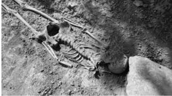
Figura 2: Esquelet d'una de les fosses de Sant Pere.