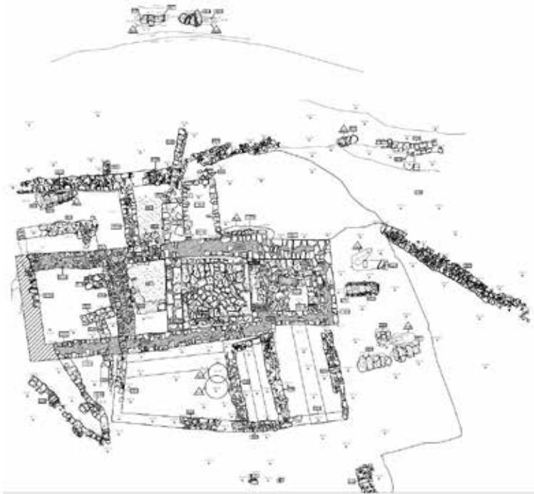
Figura 1: Planta de l'església de Sant Pere. Setembre de 2018.