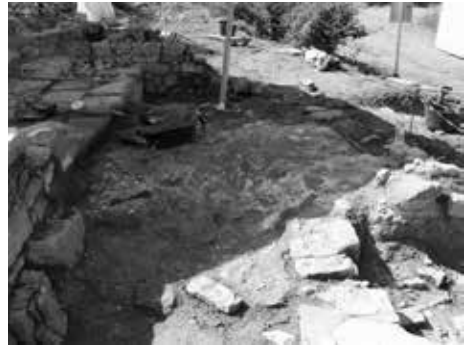
Figura 9: Morter de guix en un dels estrats de l'església.

En la campanya de 2018, a la torre es van trobar dues sepultures. Una d'elles, molt malmesa, era a sota dels murs exteriors de la domus. L'altra, en molt millor estat, es troba a l'interior de la sala de la torre.