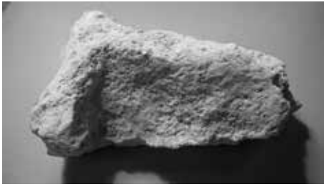
Figura 6: Morter de guix de la torre que es va analitzar.