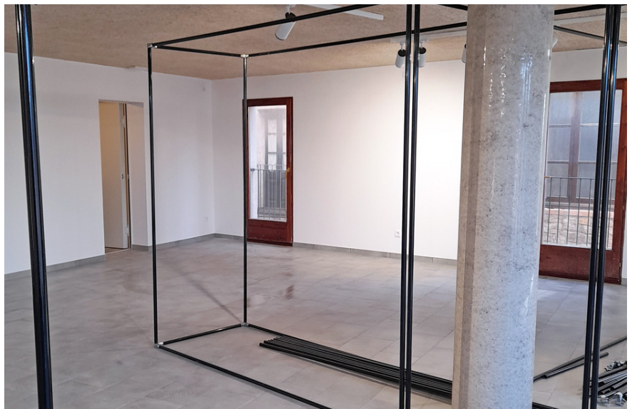
Preparació de l'espai del Casinet per instal·lar el centre d'acollida del Museu El futur equipament respondrà al concepte d'ecomuseu, fortament integrat en el territori.

El centre d'acollida del Museu serà ubicat en la segona planta del Casinet del Poble Vell. Aquest espai, contigu a Cal Balaguer del Porxo, ha estat objecte d'obres d'adequació en els darrers mesos per part de l'Ajuntament. El centre d'aco-