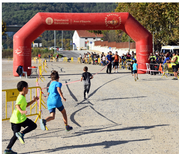
El Cros Escolar atreu centenar de participants L'esport és un factor d'integració i foment de la salut.

L'àrea d'Esports ha fet accions per promoure l'activitat física en totes les edats, donar suport a les entitats esportives i vetllar pel correcte funcionament d'instal·lacions i equipaments. En aquest mandat, a més, s'ha fet un important pas endavant per dinamitzar el món esportiu de la vila, amb la creació del Consell Municipal de l'Esport.