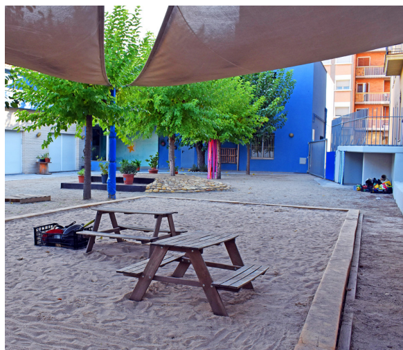
Renovació del pati de l'Escola Bressol Petit Estel Els centres municipals ofereixen una formació de qualitat.

Un dels eixos de la col·laboració amb els centres escolars és el programa Súria Municipi Lector, que vol promoure la lectura amb diferents activitats coordinades per la Biblioteca Pública. També es van distribuir uns 180 llibres infantils i juvenils als centres d'ensenyament