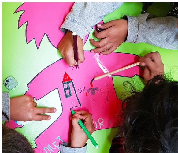
Activitat dels infants del Centre Obert El Brot

L'àrea de Benestar Social ha participat activament en la creació, per primera vegada a Súria, d'un parc d'habitatges públics municipals per tal d'atendre situacions de necessitat i emergència social.