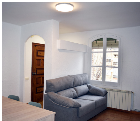
Interior d'un dels nous habitatges municipals Súria compta per primera vegada amb aquest servei.

La creació d'aquest parc municipal d'habitatges és un primer pas que haurà de continuar amb noves adquisicions per tal d'ampliar la do-