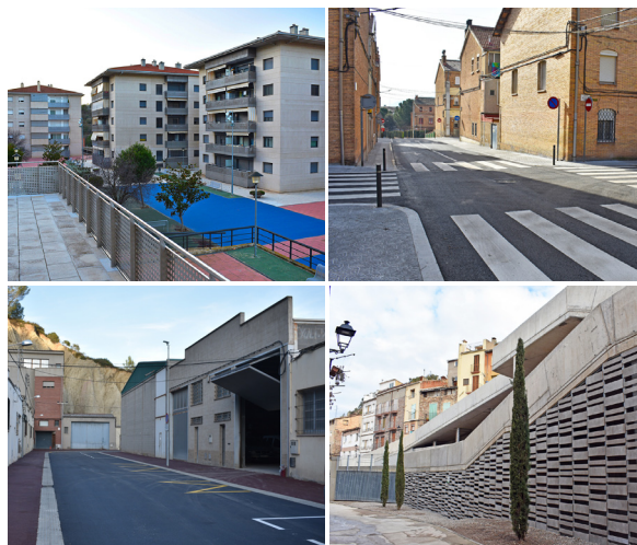
Actuacions realitzades a diferents barris de la vila Imatges de Salipota, Santa Maria, Joncarets i Sant Jaume.

És el cas de les obres del barri de Santa Maria, que es van desenvolupar al llarg de l'avinguda Santa Bàrbara i d'un tram del carrer Doctor Fleming. Els treballs van permetre millorar l'accessibilitat, l'estat del ferm i la senyalització general del sector. També van fer possible la renovació dels serveis d'aigua potable i la xarxa de clavegueram.