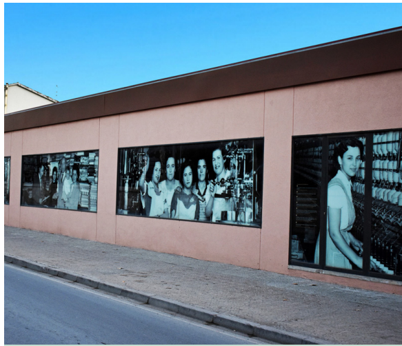
Fotografies històriques a l'entrada del centre urbà Les actuacions s'han estès pels diferents barris de la vila.

Les intervencions realitzades han consistit en treballs d'asfaltatge, reparació de la via pública, millora de la seguretat, instal·lació de mobiliari urbà i neteja d'elements malmesos o vandalitzats, entre d'altres. En la detecció d'aquestes necessitats d'actuació, s'ha comptat amb la participació de les entitats veïnals i amb nous serveis com el canal de comunicació d'incidències Línia Verda, obert a tota la ciutadania, i que ha registrat