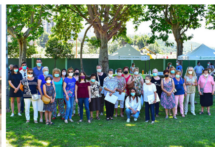
El parc infantil de la plaça de Sant Joan és un dels que ha estat renovat

A sota, imatge de la nova rotonda i homenatge a les cosidores de mascaretes.