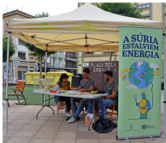
Estand d'informació sobre l'estalvi d'energia La preservació del medi ha de comprometre tothom.

D'altra banda, el Ple Municipal ha aprovat durant aquest mandat l'inici dels tràmits per tal d'implementar a Súria un nou model de contenidors intel·ligents de recollida selectiva.