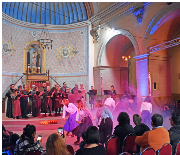
Actuació de la darrera Fira Medieval d'Oficis El programa d'actes ha estat ampliat i renovat.

L'ampliació del programa de la Fira, amb un espectacular acte inaugural en el centre de la vila, nous