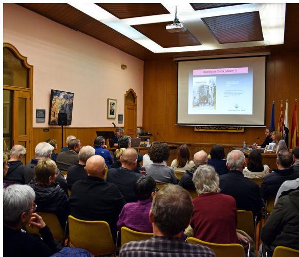
Presentació del primer volum de la història de Súria El suport a la cultura i a les entitats, un objectiu bàsic.

La Biblioteca Pública ha mantingut una activitat constant d'organització d'actes de dinamització cultural per a infants i adults. També és destacable l'increment dels fons de l'Arxiu Municipal, gràcies a les gestions per formalitzar importants donacions, i la continuïtat de la Campanya d'Excavacions Arqueològiques a les Guixeres. L'àrea de Cultura ha impulsat un programa commemoratiu sobre el poeta Salvador Perarnau, recupe-