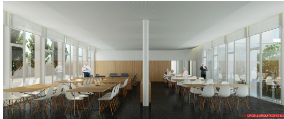
Projectes de la Biblioteca Pública (dalt) i del SAIAR Les subvencions es perdran si la tramitació s'atura.

da al compromís que la seva construcció s'hagi completat el setembre de 2025. Es tracta de la subvenció més alta atorgada mai per un únic projecte a Súria.