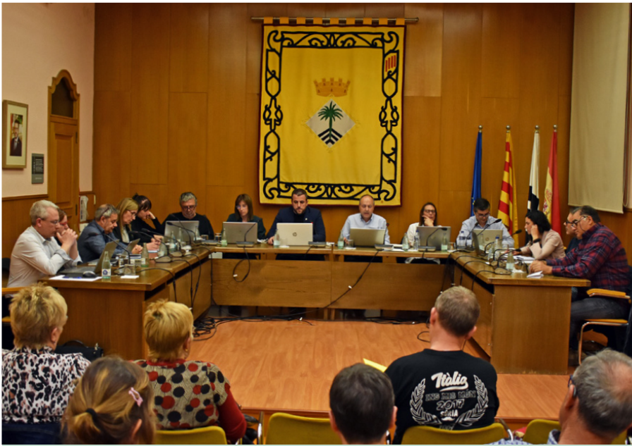
Imatge d'una sessió recent del Ple Municipal al saló de sessions de la Casa de la Vila.