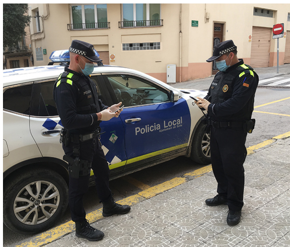
Agents de la Policia Local, durant el confinament

L'àrea de Sanitat, juntament amb l'Alcaldia, va coordinar les actuacions dels serveis municipals i del voluntariat per tal d'intentar donar respostes ràpides a totes les necessitats que s'anaven plantejant, en contacte directe amb l'equip del CAP Goretti Badia i les entitats socials. Al llarg del mandat s'han portat a terme diferents campanyes i accions informatives per tal de sensibilitzar