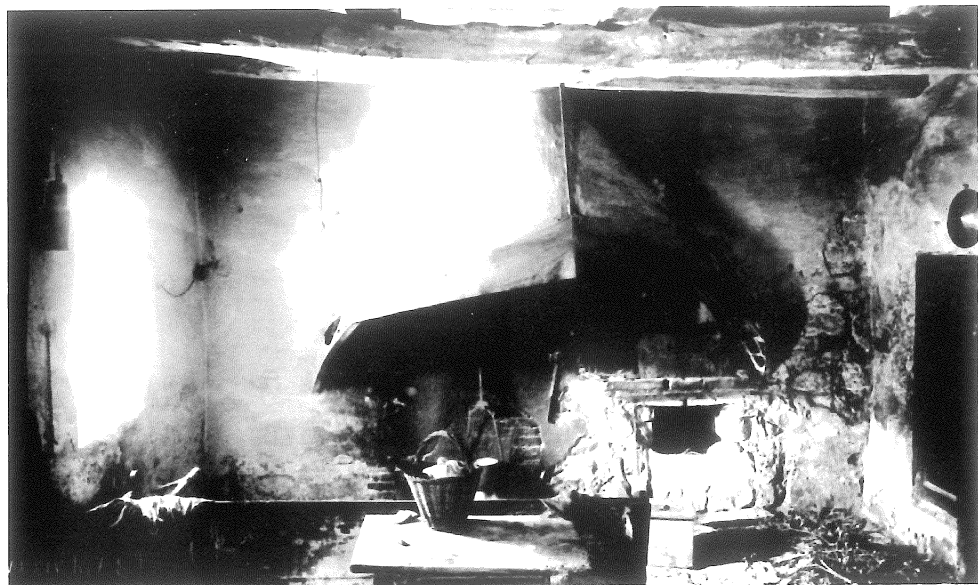
Figura 2. Cuina més o menys típica del segle XVIII.