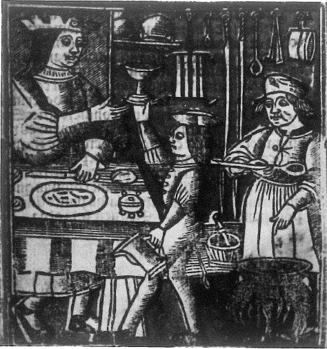
Figura 3. Estris de cuina. Any 1520.