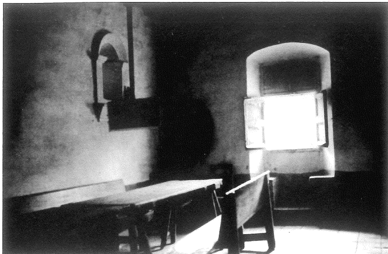
Figura 1. Sala més o menys típica del segle XVIII.

trobat la seva existència en cap dels inventaris de què disposem. Probablement rostir l'aviram i altres animals a l'ast formava part de la cuina dels nobles i rics, i no de les masies i de les cases populars.